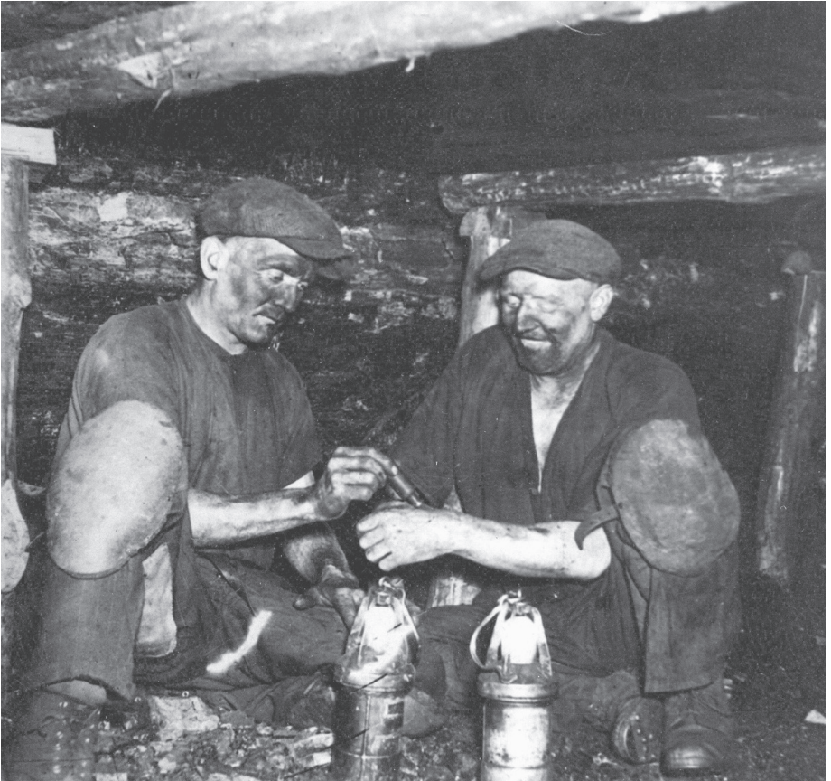
• Ondergrondse mijnwerkers pauzeren / poseren. Het overgrote deel van de stakers in België waren mijnwerkers.

kwamen in actie om te protesteren tegen de reorganisatie van de arbeidstijd : het kon gaan om een nieuw werkrooster of om een nieuwe uurregeling van de treinen, waarbij van de patroon verwacht werd dat hij de arbeidstijd aanpaste 8 .