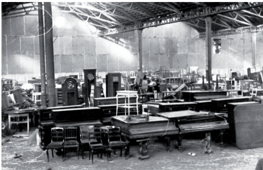
• Meubles spoliés de Juifs provenant des territoires occupés par l'Allemagne nazie.

Dans un premier temps, les meubles saisis étaient mis à la disposition du RMfdbO , mais comme nous le verrons, ils furent ultérieurement destinés aux villes allemandes endommagées par les bombardements alliés 8 .