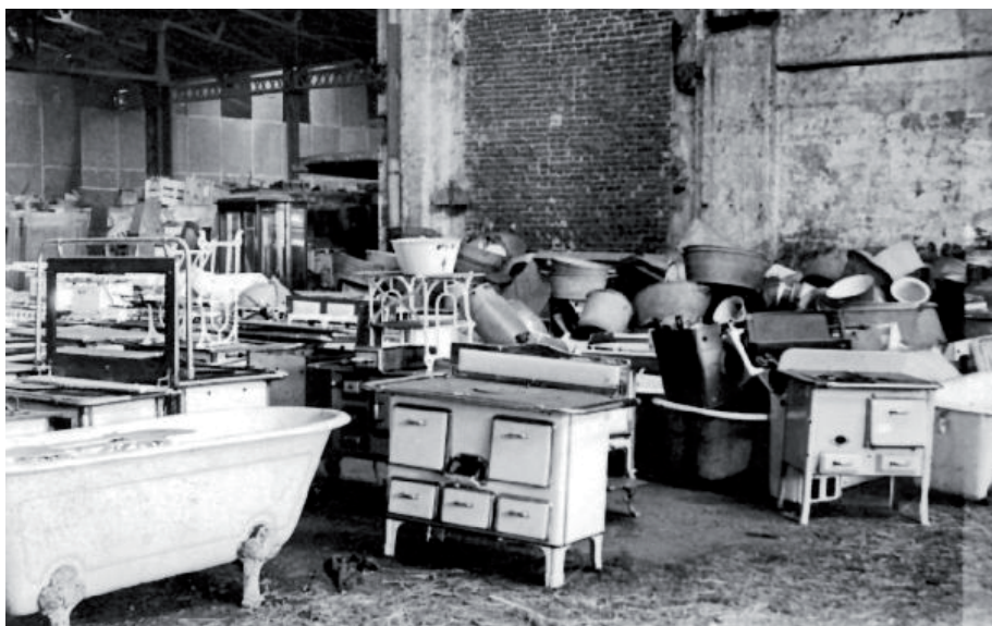
• Mobilier spolié de Juifs d'Europe occidentale, entre autres baignoires et cuisinières, dans le dépôt d'Oberhausen. (Photo ARCHIVES DE LA VILLE D'OBERSHAUSEN, n° 0712-413)

L'acheminement des meubles vers l'Allemagne permettait de combler les carences en objets d'ameublement provoquées par le ralentissement de la production de meubles.