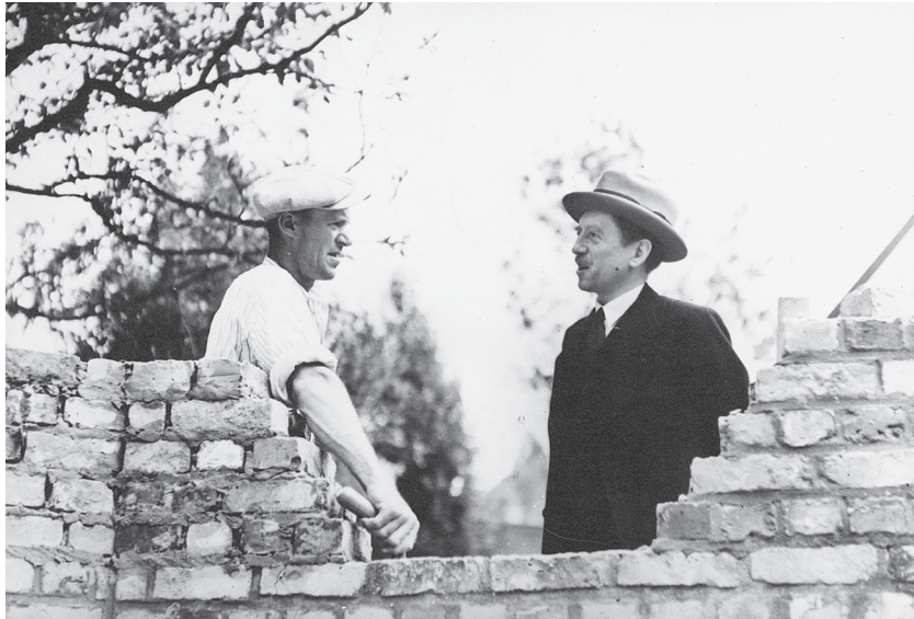
Karel Verwilghen, secretaris-generaal van het Ministerie van Arbeid en Sociale Voorzorg, in gesprek met een metselaar. Onder Verwilghens bevoegdheid werd de Nationale Dienst voor Arbeid en Toezicht (NDAT) op 10 april 1940 omgevormd tot het Rijksarbeidsambt (RAA).