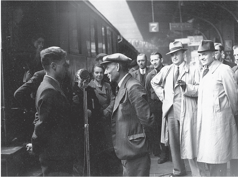
Een arbeider die voor vrijwillige arbeid naar Duitsland vertrekt wordt in het Brussels Noordstation voor de microfoon gehaald om zijn woorden voor propagandadoeleinden in te zetten.