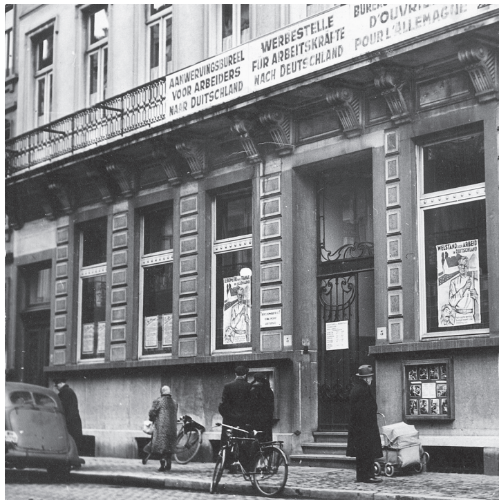
De Werbestelle in de Naamsestraat in Brussel, waar zowel de vrijwillige als de verplicht tewerkgestelden zich moesten aanmelden.