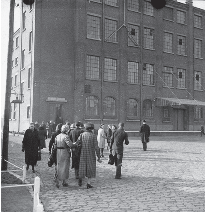
Werkneemsters van Reitz Uniformwerke die zich naar het dagelijks werk begeven (Foto SOMA nr. 3432)