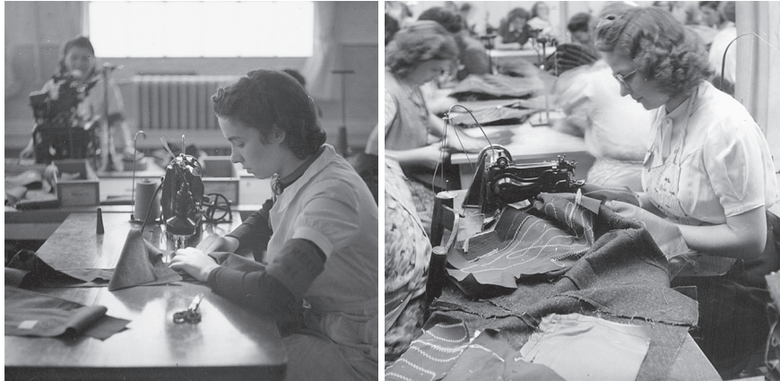
Voorgesneden patronen worden in de Reitz Uniformwerke vakkundig tot uniformen aaneengenaaid. (Foto's SOMA nrs. 3387, 3412)