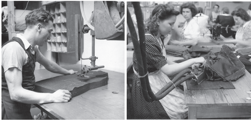
Voorafgaand aan het naaien vergde de productie in de Reitz Uniformwerke vele andere processen: het uittekenen van de patronen met vetkrijt, snijden en strijken.