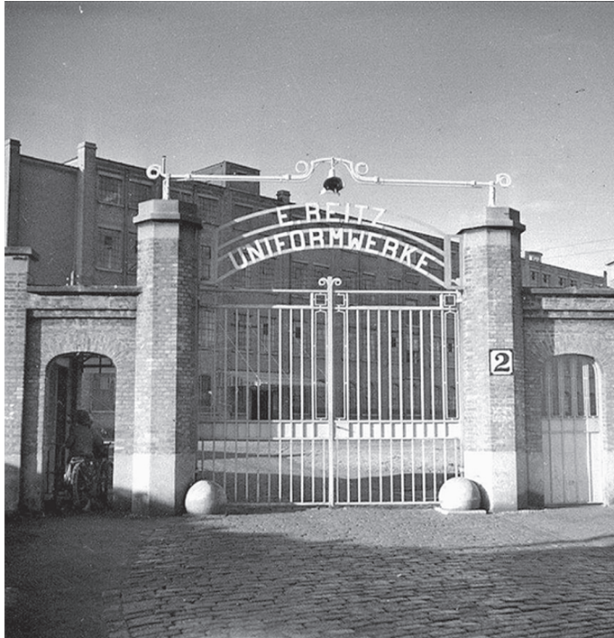
De toegangspoort van Reitz Uniformwerke.