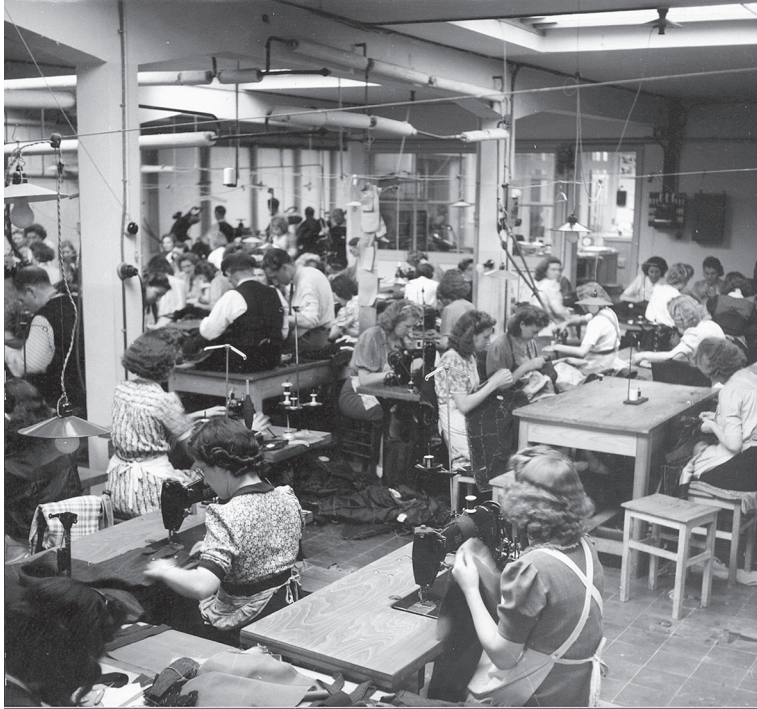
Naaisters aan de slag in een atelier van de Reitz Uniformwerke.