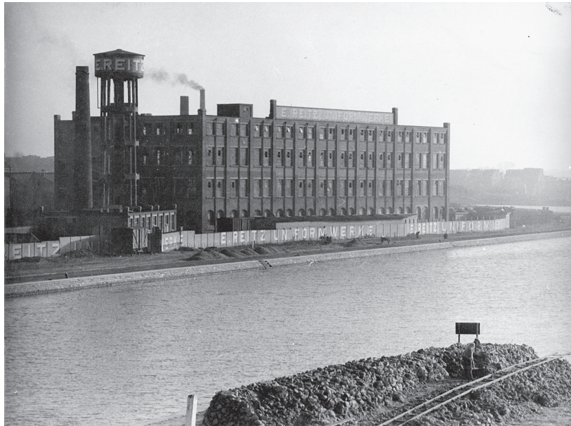
De Reitz Uniformwerke aan het Albertkanaal in Merksem, 21 april 1943.