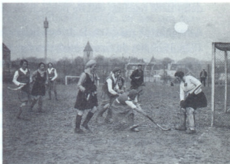
• Ook in betere kringen stonden Nederland en België in sportontmoetingen tegenover elkaar. Op deze foto uit 1932 een hockeystrijd voor vrouwen in Brussel.

De regering in Le Havre beschikte evenmin over de Bescheiden betreffende de Buitenlandse Politiek van Nederland of de verzamelde werken van Lode Wils. Men zou met een boutade kunnen zeggen dat de Belgische regering even weinig vermoedde van de Duitse plannen als de Neder-