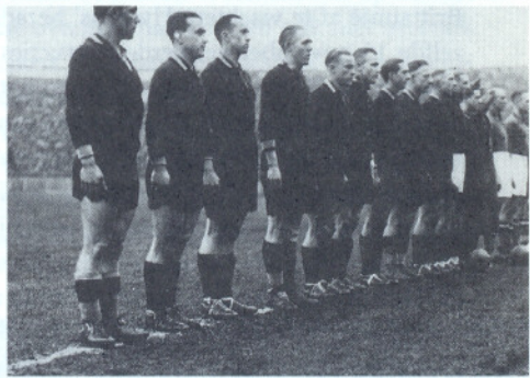
• De legendarische voetbalwedstrijden tussen België en Holland. Hier in maart 1940 in Antwerpen: België won.