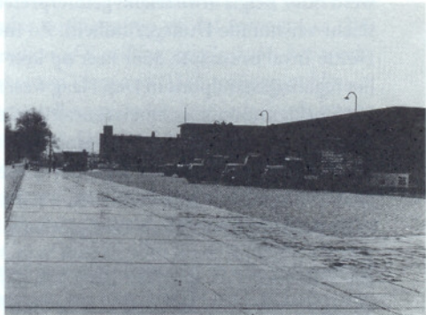
* De grensovergang tussen Nederland en België in Weerhout in de dertiger jaren.

België nam het Nederland bijna kwalijk dat het niét aangevallen was, de neutraliteit van het buurland werd als regelrecht verraad aangevoeld. Pers, publieke opinie en vele politici in België – en in Frankrijk – dachten in termen van us en them , Nederland, zoveel was duidelijk, was not one of us . Eind augustus deed zelfs het gerucht de ronde dat Frankrijk de oorlog verklaard had aan Nederland! Het bleek bijzonder moeilijk om dit anti-Nederlandse tij te keren. De officiële rechtzettingen, zowel van Belgische als van Nederlandse zijde, maakten maar weinig indruk op de publieke opinie. Zo kloeg de Nederlandse consul in Gent dat het «opmerkelijk» was «dat alleen in België steeds weer nieuwe sensationele berichten over Holland worden verbreid, welke gretig als feiten