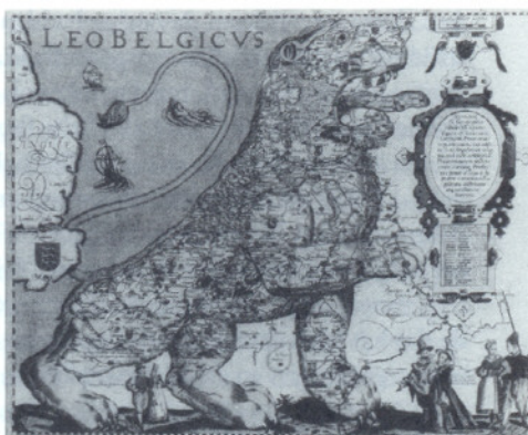
• De Leo Belgicus dateert reeds van 1583. In het interbellum waren België en Nederland op bepaalde terreinen lang niet meer zo nauw met elkaar verweven.

De neutraliteit was meer dan een gewoonte geworden: zij werd beschouwd als een talisman, die het land beschermde en toeliet voorspoedig te leven. Na het Duits ultimatum aan Frankrijk en Rusland op 31 juli werd de algemene mobilisatie afgekondigd, maar regering en publieke opinie bleven tot het bittere einde hopen dat België, net als in 1870, aan het conflict zou ontsnappen. De kranten riepen eensgezind op tot "kalmte en vertrouwen". Op 2 augustus schreef Julius Hoste jr. in Het Laatste Nieuws : «Laat ons midden het orkaan dat over Europa losbarst, de noodige kalmte bewaren. Duitschland en Frankrijk hebben beloofd de onzijdigheid van België te eerbiedigen.... Niets kan een paniek in België wettigen». Nog op 3 augustus klampte Le Soir zich vast aan de Paroles rassurantes du ministre d'Allemagne à Bruxelles 4 . Gelijkaardige reacties blijken ook uit de procesverbalen van het Bureau van de BWP. In de periode tussen 28 juni en 4 augustus kwam de internationale situatie welgeteld één keer aan bod: pas op 30 juli werd er kort gesproken over de stijgende spanning in Europa en over de positie van België 5 . Het ultimatum van 2 augustus, waarin Duitsland vrije doorgang vroeg door België, maakte evenwel een einde aan alle illusies.