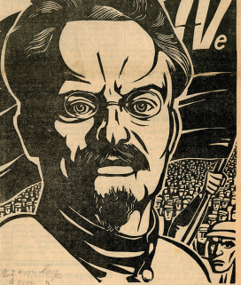
LE GOUVERNEMENT SOCIALISTE... L'APPEL DE L'AVOYÉ DE TROTSKY A LA PROLETARIAT... L'INTERPELLATION STALINISTE