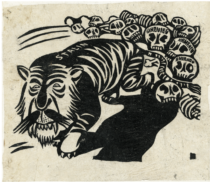
Stalin als bloeddorstige tijger op zoek naar verse prooien. Vele revolutionairen en bolsjewieken van het eerste uur (Smirnov, Kamenev, Zinoviev) werden al verslonden. Spotprent door Franz Meyer, s.d. (AMSAB -ISG)