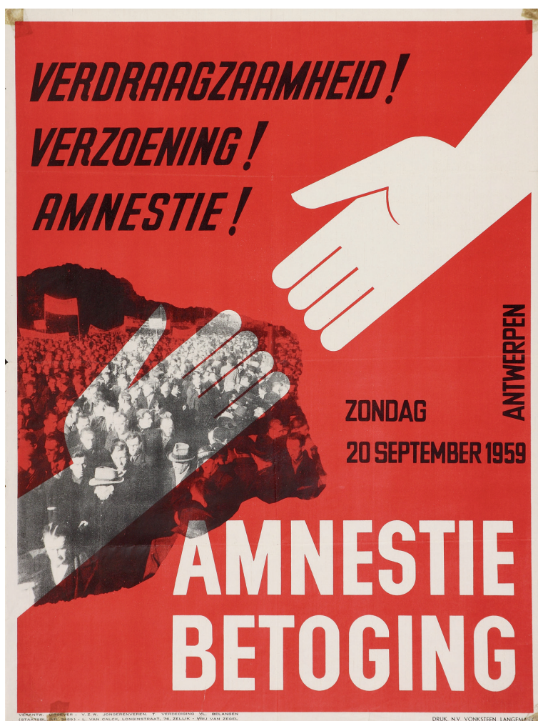
Affiche van de grootste amnestiebetoging na de Tweede Wereldoorlog. Ze werd georganiseerd door een ad-hoccomité waarvan vele Vlaamsgezinde strijdorganisaties deel uitmaakten. Ook het Verbond van het Vlaams Verzet van de CVP-politicus en politiek gevangene Louis Kiebooms zette er zijn schouders onder. Volgens de rijkswacht waren er 7000 betogers, de organisatoren telden er twee keer meer. Enkele honderden verzetsveteranen betoogden tegen en hadden het vooral op Kiebooms gemunt.