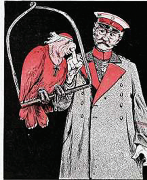
« Ce que nous tenons, nous le tenons bien ! »

Als boegbeeld van het verzet tegen de Duitse bezetter genoot kardinaal Mercier in Franstalige patriottische kringen een ijzersterke reputatie. In deze spotprenten dient de als papegaaï afgebeelde kardinaal de vermanende vinger van gouverneur-generaal von Bissing van antwoord.