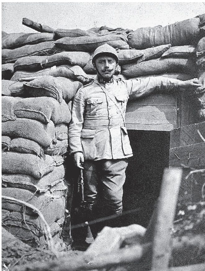
Er zijn honderden bekende en minder bekende foto's van de soldaten aan het IJzerfront, in de met "vaderlandertjes" (zandzakjes) opgebouwde loopgraven. Met bezorgde blik kijkt deze soldaat in de lens. (Foto CEGESOMA, nr. 198937)