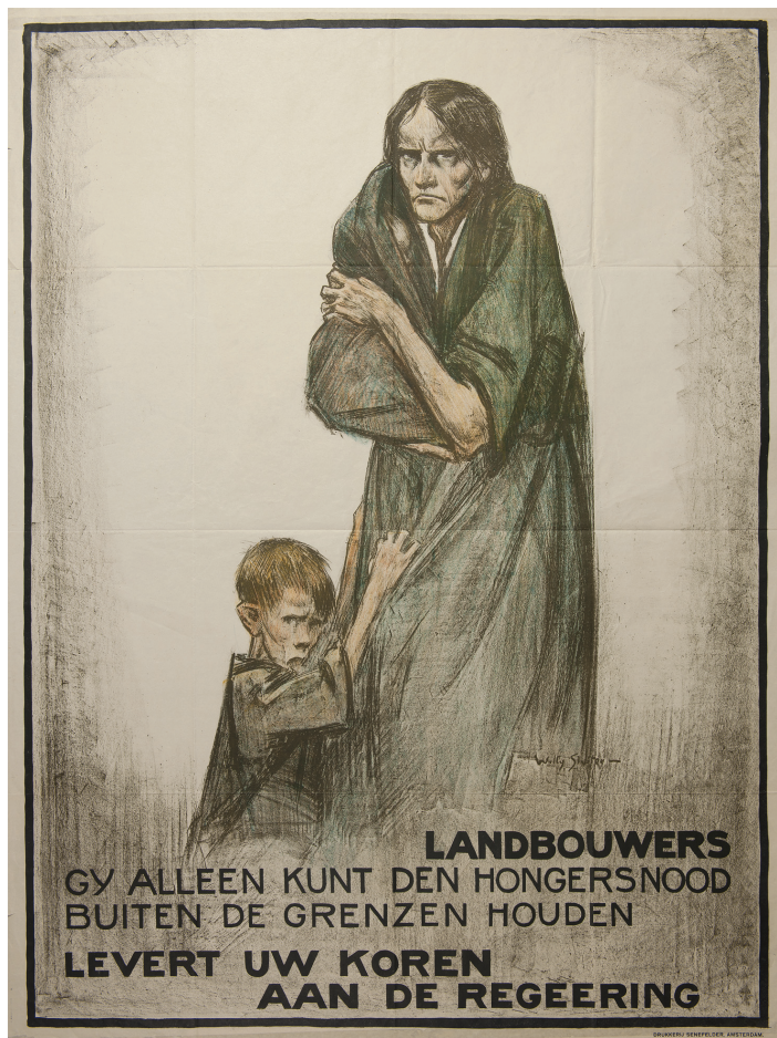
Voedseltekort en hongersnood waren tijdens de Eerste Wereldoorlog schering en inslag in het bezette België. Eén van de vele affiches waarop landbouwers werden aangemaand hun voedselvoorraden ter beschikking te stellen. (Affiche Koninklijk Legermuseum)