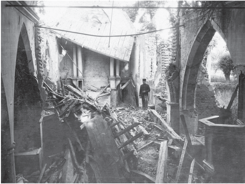
Het dorp Sint-Jacobskapelle, in de buurt van Diksmuide, lag midden in de frontlinie. De Sint-Jacobskerk werd er volledig verwoest.