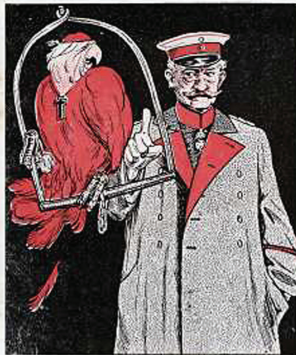
Herr von Bissing und der belgische Kardinal Hier wird DEUTSCH gesprochen, alter Junge, verstehe!