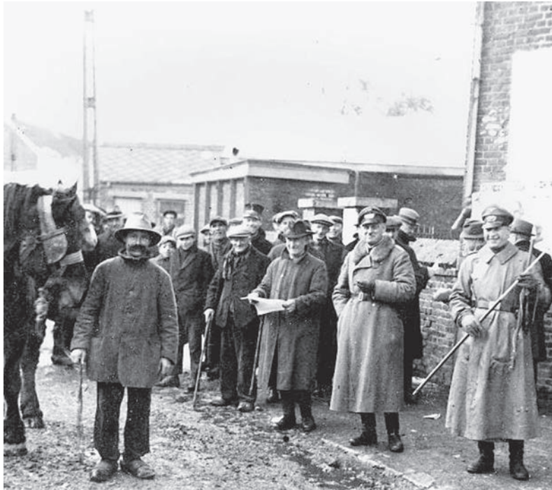
De Duitse bezetter eiste alles op wat kon dienen. In het Waalse dorp Perwez werden de paarden opgeëist. Met een stok meet een Duitse militair rechts de hoogte van de paarden.