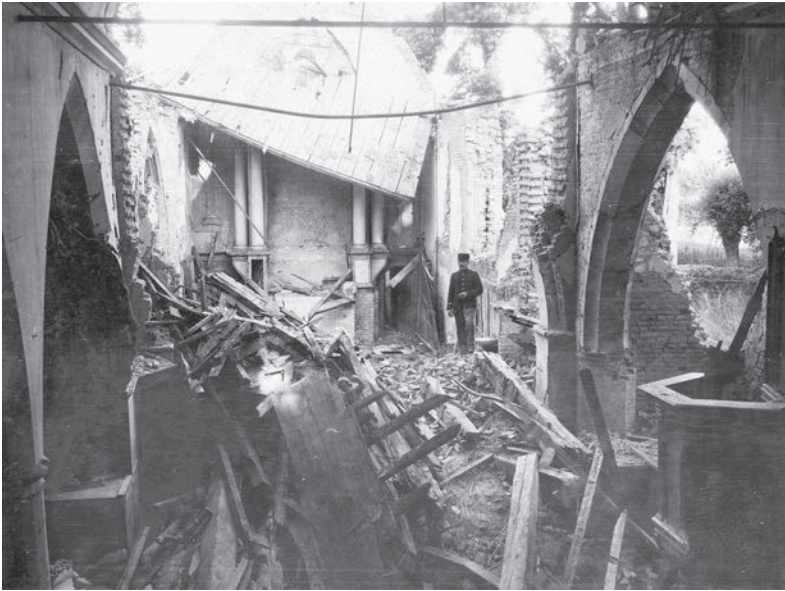
Het dorp Sint-Jacobskapelle, in de buurt van Diksmuide, lag midden in de frontlinie. De Sint-Jacobskerk werd er volledig verwoest. (Foto CEGESOMA, nr.164799)