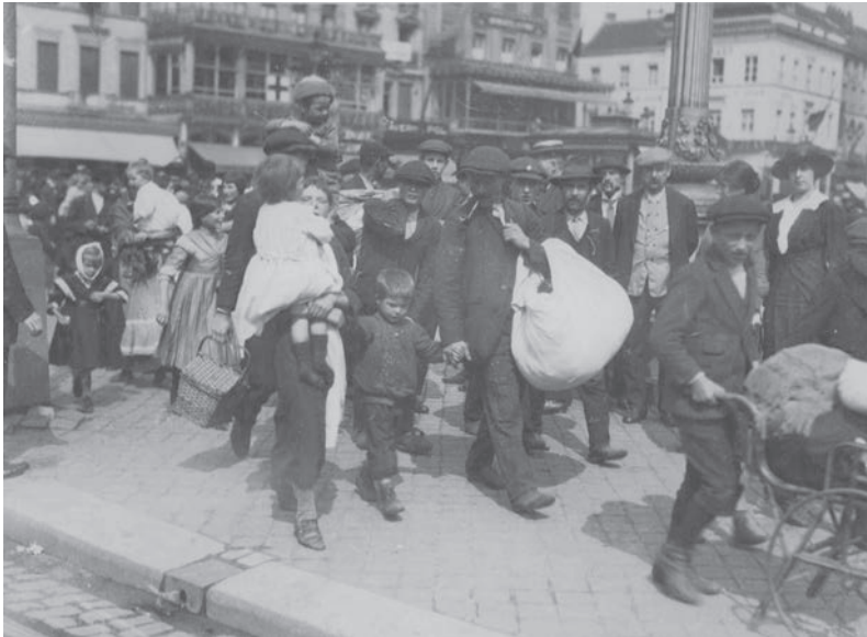
In het hele land sloegen burgers op de vlucht om aan het oorlogsgeweld te ontsnappen. Vluchtelingen in Brussel in 1914.