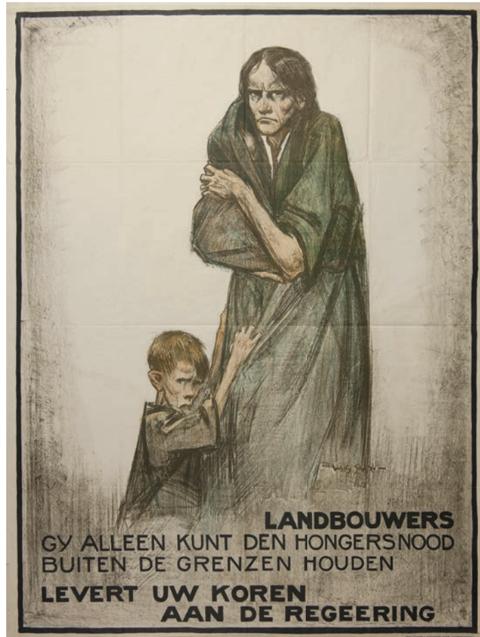
Voedseltekort en hongersnood waren tijdens de Eerste Wereldoorlog schering en inslag in het bezette België. Eén van de vele affiches waarop landbouwers werden aangemaand hun voedselvoorraden ter beschikking te stellen.