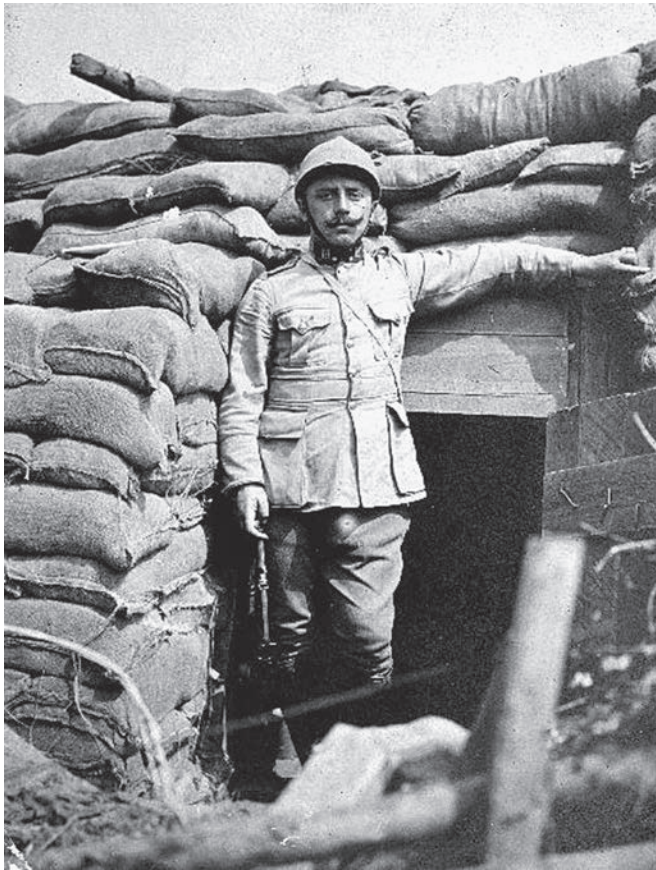
Er zijn honderden bekende en minder bekende foto's van de soldaten aan het IJzerfront, in de met "vaderlandertjes" (zandzakjes) opgebouwde loopgraven. Met bezorgde blik kijkt deze soldaat in de lens.