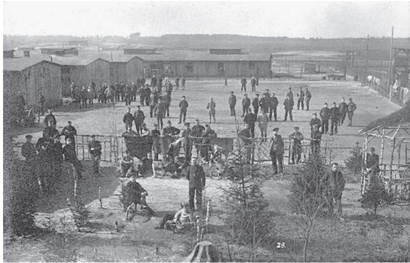
In het Noord-Duitse Soltau bevond zich het grootste Duitse krijgsgevangenenkamp uit de Eerste Wereldoorlog, waar behalve Franse ook meer dan 10.000 Belgische soldaten werden geïnterneerd. (Foto CEGESOMA, nr. 286787)