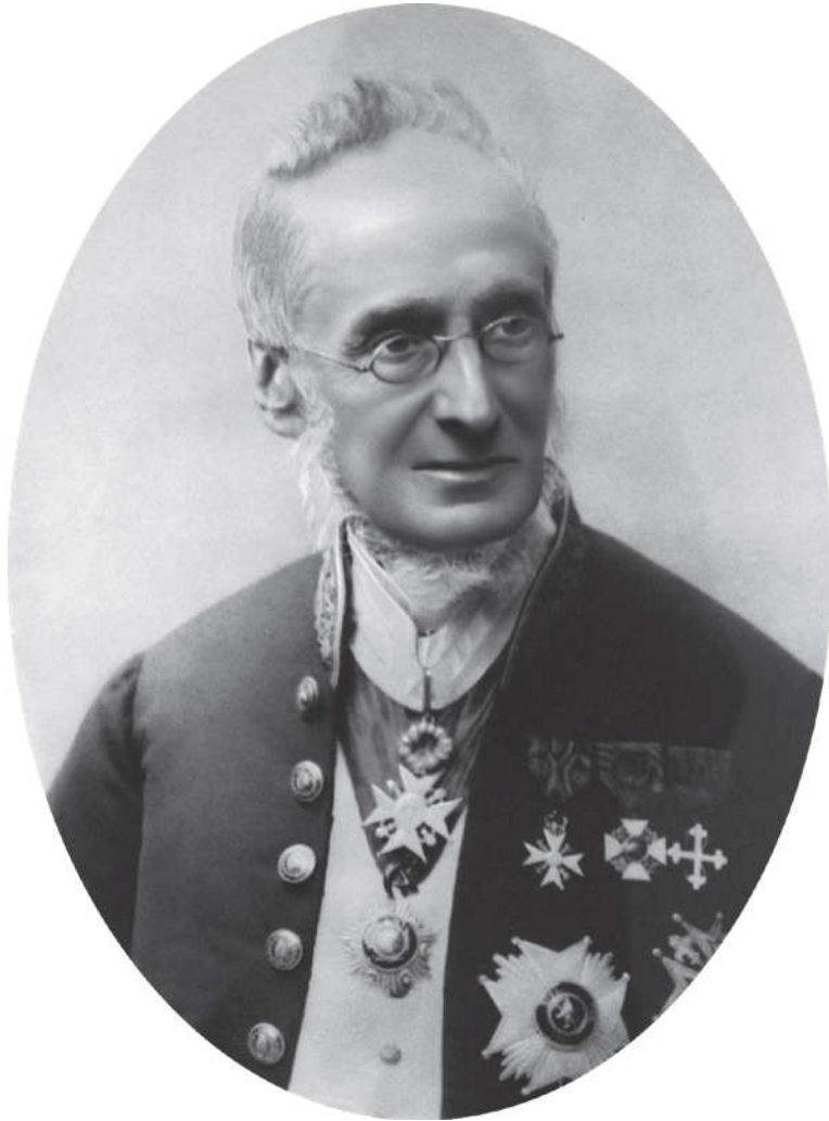
Lambert van der Rest (1817-?), secrétaire général des Finances de 1860 à 1890.