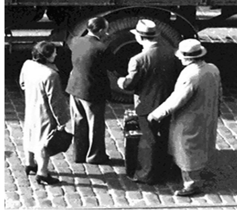
• Man zonder hoed met sigaret. Bemerkt ook de twee valiezen.

lijst' lijken hun werk zwijgzaam, uiterst geconcentreerd te doen. De man zonder hoed voor de wagen rookt een sigaret. Rechts voor de laadklep leunt een blijkbaar wat oudere man op een stok. En uiterst rechts in beeld komt een op het eerste gezicht ook wat oudere vrouw met bonnet haastig aangelopen (zie ook detailfoto p. 216, bovenaan). Maar in feite is het moeilijk exact te bepalen wie van degenen die rond de vrachtwagen staan al dan niet tot de 'te vervoeren' behoren. Evenmin lijkt er een davidster te bespeuren, maar onderduikers droegen die uiteraard niet. Bovendien zijn de meeste mensen slechts op de rugzijde te zien. Opvallend is ook dat niemand tekenen van verwondingen schijnt te vertonen. Bij het oppakken van Joden werd meermaals geweld gebruikt, meestal vuistslagen of slagen met ter plekke gevonden huishoudgerief als pollepels, stoofhaken en mattenkloppers. Dat was vooral een specialiteit van de Vlaamse Jodenjagers, in het bijzonder van Felix Lauterborn. "Bij elk konvooi van Lauterborn", aldus een naoorlogse getuigenis van een Joodse gewezen zaaloverste in de Dossin-kazerne, "waren er steeds mensen met afschuwelijke gezichten, die dadelijk naar de ziekenzaal gingen" 9 . Lauterborn, immer duidelijk herkenbaar aan zijn puntbaardje (foto p. 220) en kleine gestalte, valt op de foto echter niet te bespeuren. In de herfst van 1943 stapte hij over van de Judenabteilung van de Sipo-SD naar de Antwerpse afdeling van