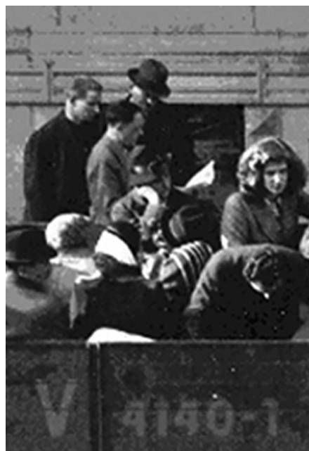
• Achter de vrachtwagen, met nummer V 4140-1, mannen met lijst (?).

Achter de wagen links staat een aantal personen in burger, waarvan een met hoed, die blijkbaar een lijst in handen hebben en deze controleren. Ook de mannen met witte pet rechts achter de wagen onder nummer 52 springen in het oog en doen mogelijk hetzelfde werk. De scène doet denken aan de foto met de vrachtwagen in de Dossin-kazerne. Bij razzia’s trad de Sipo-SD en haar Belgische handlangers