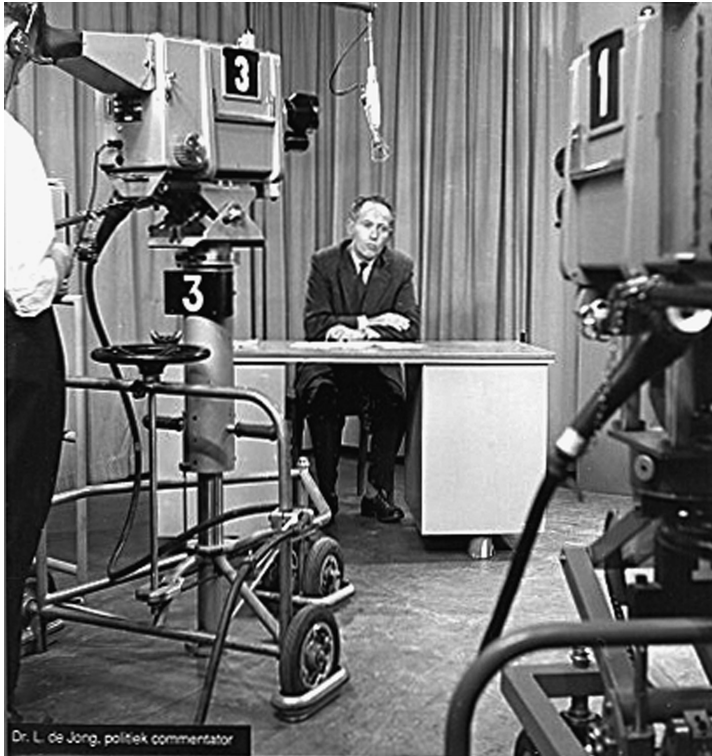
• Loe de Jong in de studio ten tijde van de tv-reeks De Bezetting in de jaren 1960.

De Unie werd in het televisieprogramma niet zozeer als “fout”, maar wel als “naïef” getypeerd, hun leiders hadden zich “vergist”. Kritiek op de Unie kon dus wel, maar principieel stond men aan dezelfde kant 104 . In 1972 trachtte men vanuit de kring van het driemanschap van de Nederlandsche Unie om de publicatie van het vierde boekdeel van Loe de Jong ( Mei '40 – Maart '41 ) te verhinderen, maar het RIOD kreeg van de overheid toch toestemming tot publicatie (en dus ook financiering) 105 . Interessant is dat de bewuste aflevering in de herwerkte heruitzending vijftig jaar na de bevrijding (zie verder) alsnog genuanceerd werd : de oprichters van de Unie waren het onderling sterk oneens geweest over de accommodatiepolitiek met de bezetter en vele aanhangers van de Unie waren later in het verzet actief geweest. Ook hier werd Nederlands eer dus alsnog “gered” 106 .