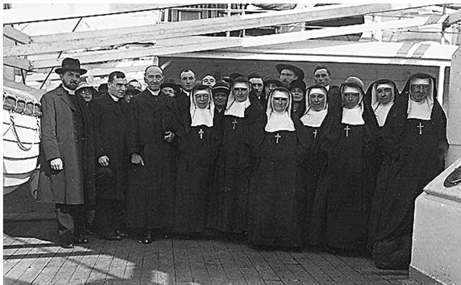
• Missiezusters van de West-Vlaamse Congregatie van Onze-Lieve-Vrouw-ten-Bunderen op weg naar de kolonie met de Congoboot Anversville II, 6 oktober 1926.