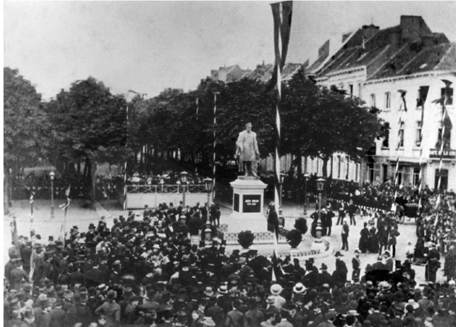
Op 10 juli 1887 werd Guislains standbeeld ingehuldigd op de Begijnhovenlaan. De inauguratie vormde een onderdeel van het feestprogramma van de Gentse Feesten, wat mogelijk de vele toeschouwers op de foto verklaart.